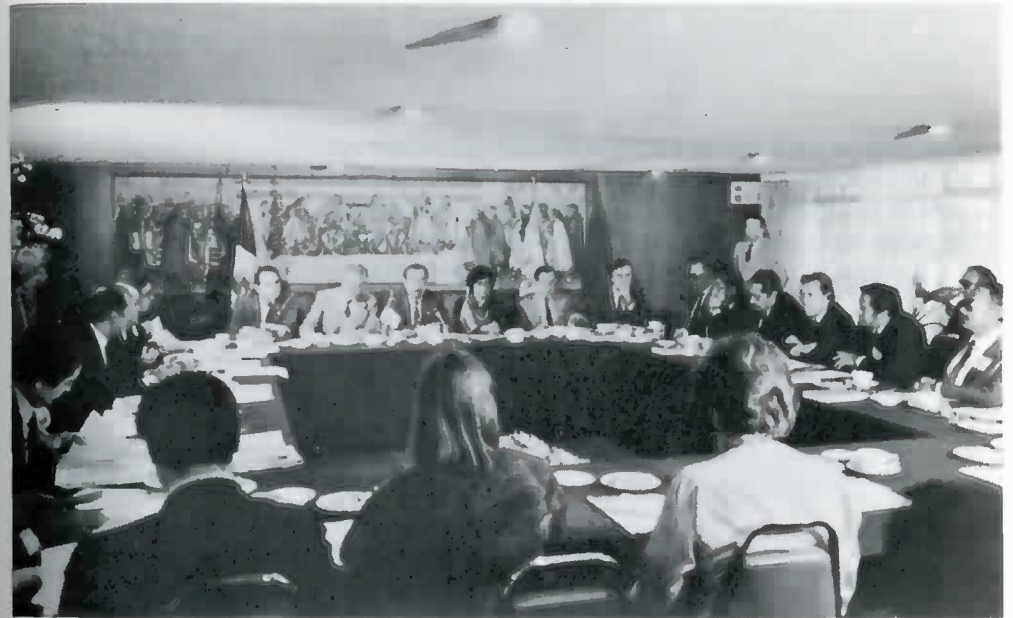
En el Senado de la República, donde se celebró la Segunda Sesión de trabajo de la II Reunión Interparlamentaria México-España, el Senador Antonio Riva Palacio, dio la bienvenida a los parlamentarios españoles.