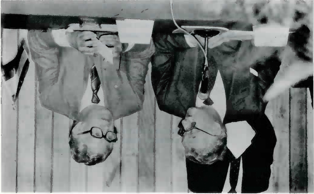
Senador José Federico de Carvajal Pérez, Presidente del Senado Español, y el líder de la Gran Comisión de la Cámara de Diputados, Eliseo Mendoza Berrueto, durante la II Reunión Interparlamentaria México-España.