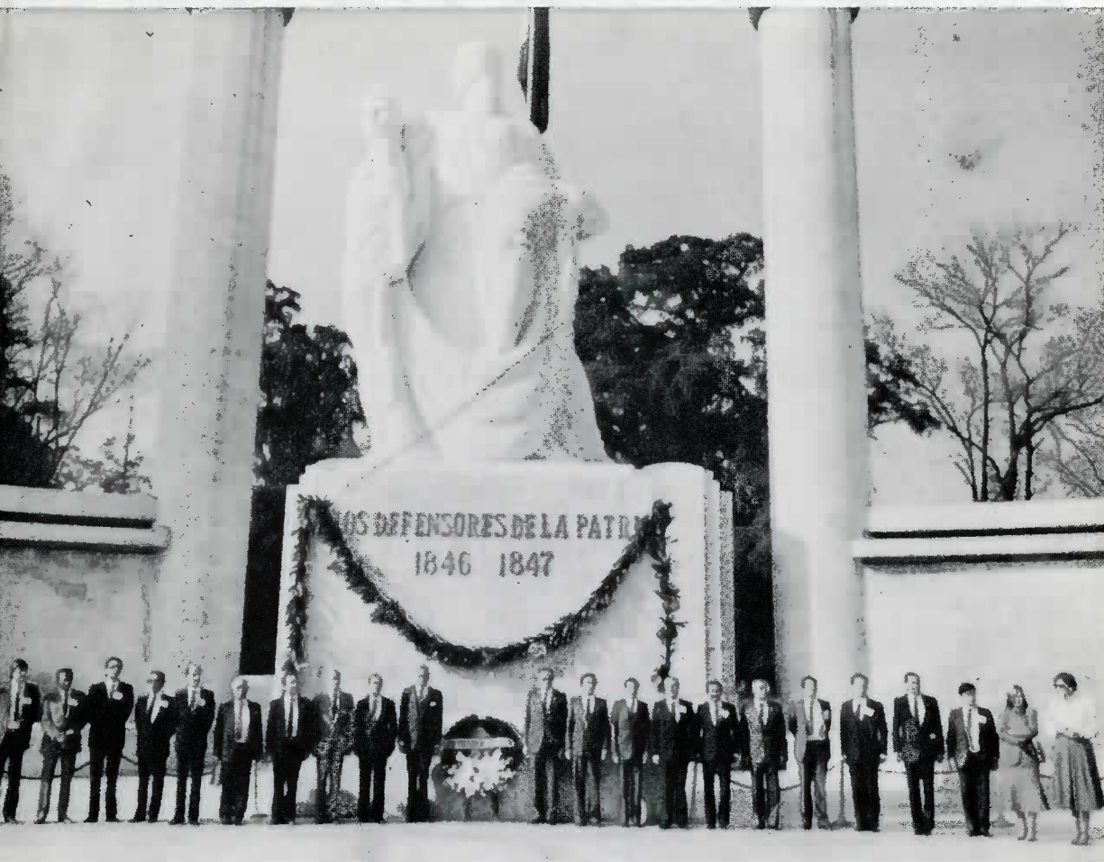
Durante la II Reunión Interparlamentaria México-España, los delegados de ambos países depositaron una ofrenda floral en el Monumento a los Niños Héroes y motivaron una guardia de honor.