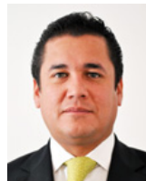
SEN. CARLOS ALBERTO PUENTE SALAS