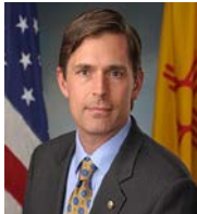
SEN. MARTIN HEINRICH (D-NM))