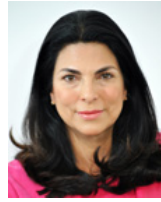
SEN. MARCELA GUERRA CASTILLO