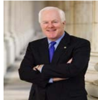
SEN. JOHN CORNYN (R-TX)