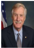
SEN. ANGUS KING (D- ME)