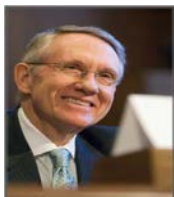
SEN. HARRY REID (D-NV)