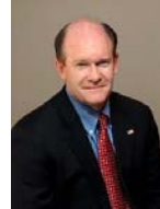
SEN. CHRISTOPHER COONS (D-DE)