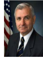
SEN. JACK REED (D-MD)