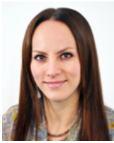
SEN. GABRIELA CUEVAS BARRÓN