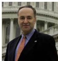
SEN. CHARLES SCHUMER (D-NY)