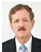
SEN. JUAN CARLOS ROMERO HICKS