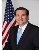
SEN. TED CRUZ (R-TX)