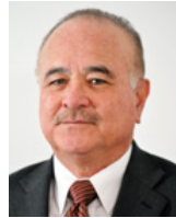
SEN. ERNESTO RUFFO APPEL