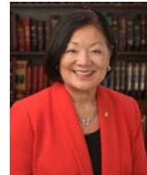
SEN. MAZIE HIRONO (D-HI)