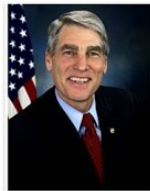
SEN. MARK UDALL (D-CO)