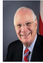
SEN. BEN CARDIN (D-MD)