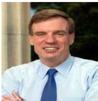
SEN. MARK WARNER (D-VA)