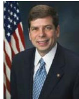
SEN. MARK BEGICH (D-AK)