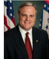
SEN. MARK PRYOR (D- AR)