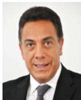
SEN. OMAR FAYAD MENESES