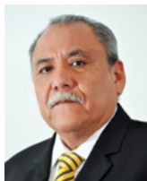
SEN. FIDEL DEMÉDICIS HIDALGO