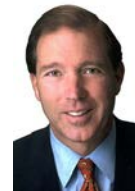
SEN. TOM UDALL (D-NM)