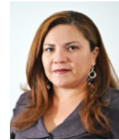
SEN. ROSA ADRIANA DÍAZ LIZAMA