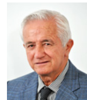
SEN. VÍCTOR HERMOSILLO Y CELADA