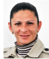
SEN. ANA GABRIELA GUEVARA ESPINOZA