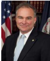
SEN. TIM KAINE (D-VA)