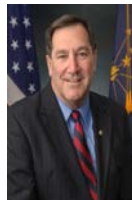
SEN. JOE DONNELLY (D-IN)