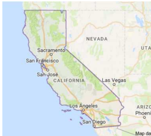
Mapa de California