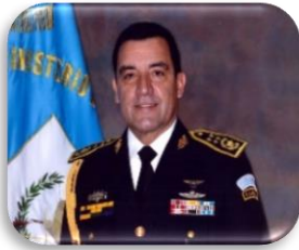
Ministro de la Defensa Nacional y Jefe del Estado Mayor de la Defensa Nacional de Guatemala