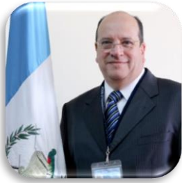
Ministro de Desarrollo Social