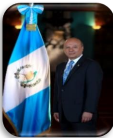
Ministro de Cultura y Deportes 🐦 @cheaurruela