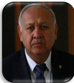
Ministro de Comunicaciones Infraestructura y Vivienda