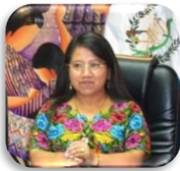
Ministra de Trabajo y Previsión Social