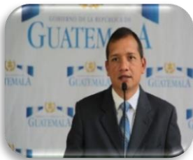
Ministro de Gobernación