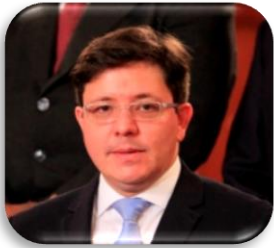
Ministro de Finanzas Públicas