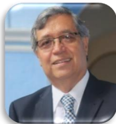
Vicepresidente de Guatemala