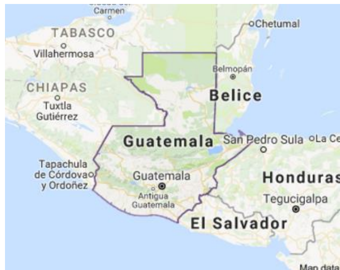
Ubicación Geográfica de Guatemala