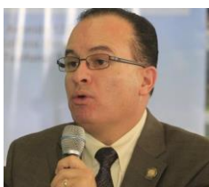
Ministro Agricultura, Ganadería y Alimentación @MagaGuatemala