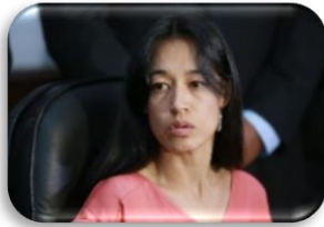
Ministra de Salud Pública y Asistencia Social