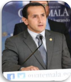
Ministro de Energía y Minas