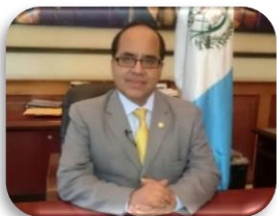
Ministro de Educación @oscar_hlopez