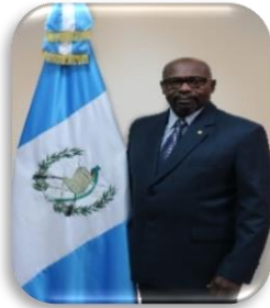
Ministro de Ambiente y Recursos Naturales 🐦 @marngt