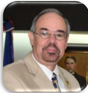
DOCTOR SANTIAGO RIVAS SECRETARIO EJECUTIVO DEL FOPREL