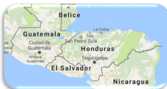
Ubicación geográfica de Honduras