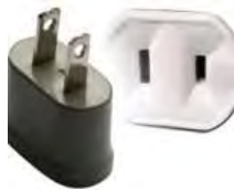
Tipo A: “Clavijas japonesas A”

Las clavijas a utilizar en Panamá son del tipo A / B: