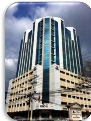
Embajada de México en Panamá

Teléfono de emergencia: (507) 6704-6215.