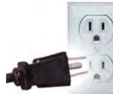
Tipo B: A veces válido para “Clavijas A”

Ambas clavijas son las de uso común en México.