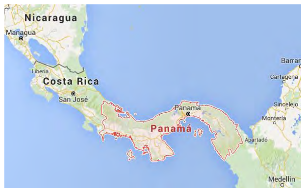
Ubicación geográfica de Panamá