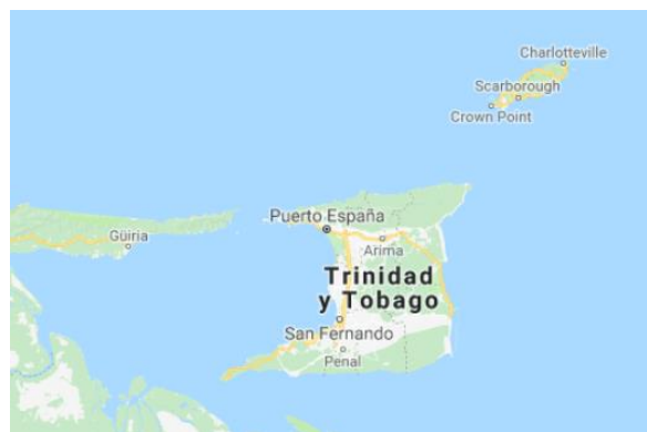
Mapa de la República de Trinidad y Tobago