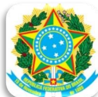
Escudo de Armas 2