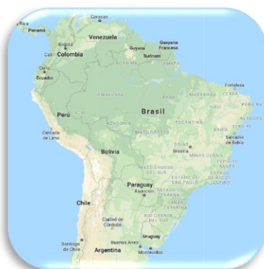
Ubicación geográfica de Brasil

1 La bandera nacional de Brasil fue adoptada por el Decreto N° 4 del 19 de noviembre de 1889. Es conocida como Auriverde y está formada por un rectángulo verde de proporción 7 a 10. Los colores verde y amarillo representan al aspecto industrial del país al caracterizar el conjunto de las producciones de la naturaleza orgánica e inorgánica. El globo terráqueo recuerda a la esfera que figuraba en la bandera del principado Honorífico del Brasil. Las estrellas, de tamaño desigual, simbolizan los estados brasileños. La posición de éstas no es arbitraria, sino que refleja un aspecto del cielo, en Río de Janeiro, el 15 de noviembre de 1889 y donde se destacaba la constelación del Cruzeiro do Sul (Cruz del Sur). En la actualidad las estrellas son 27, representando a los 26 estados y al Distrito Federal (Brasilia). Finalmente, el lema positivista " Ordem e Progresso " deja evidencia de la repercusión de las ideas filosóficas de Augusto Comte en el Brasil, a fines del siglo XIX. Es la simplificación de la frase: "El amor por principio, el orden por base y el progreso por fin". Embajada de Brasil. Símbolos Patrios de Brasil . s. l. s. f. Consultado el 25 de abril de 2018 en la URL: https://goo.gl/8EPcq1