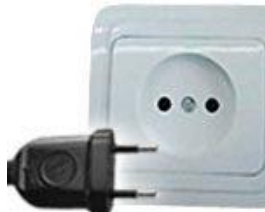
Tipo C: Válido para clavijas E y F

Las clavijas a utilizar en Bolivia son del tipo A / C: