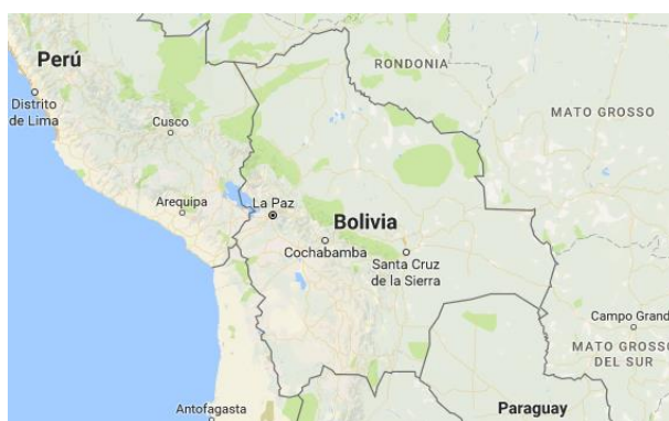
Ubicación geográfica de Bolivia

1 La Bandera de Bolivia consta de tres franjas horizontales del mismo ancho, la parte superior es de color rojo, en el centro está la franja amarilla y en la parte inferior está el fragmento verde. El color rojo significa la sangre derramada por los héroes de la República; el amarillo representa las riquezas y recursos naturales del país; y el color verde demuestra la riqueza natural y la esperanza. Sus dimensiones son: 7.5 c de alto y cada faja mide 2.5 c de alto, con una anchura de 11 c. (c cuadrado es la unidad de medida que permite ampliar y reducir proporcionalmente la imagen). Consultado el 12 de junio de 2017 en la URL: http://www.mindef.gob.bo/mindef/node/165 .