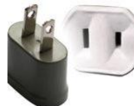
Tipo A: Clavijas japonesas A