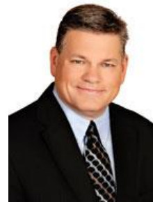
Señor Randy Hoback Miembro del Parlamento de Canadá