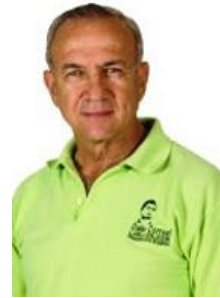
Asambleísta Octavio Villacreses Ecuador