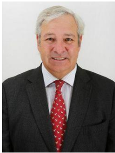
Diputado Ignacio Urrutia Bonilla Chile