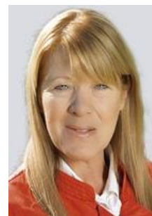
Diputada Margarita Stolbizer Argentina