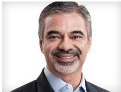
Senador Humberto Costa Brasil