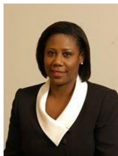
Representante Bridgid Annisette- George Presidenta de la Cámara de Representantes de Trinidad y Tobago