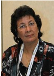
Asambleísta Jennifer Simons Presidenta de la Asamblea Nacional de Surinam