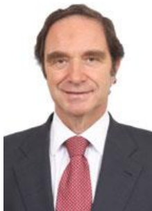
Senador Hernán Larraín Fernández 2° Vicepresidente de ParIAméricas Presidente de la Red de Parlamento Abierto Chile