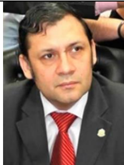
Senador Víctor A. Bogado