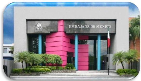
Embajada de México en Paraguay

Diferencia de Horario: +2 horas a partir del 2° domingo de marzo + 1 hora a partir del 1er domingo de abril y + 3 horas a partir de 2° domingo de octubre