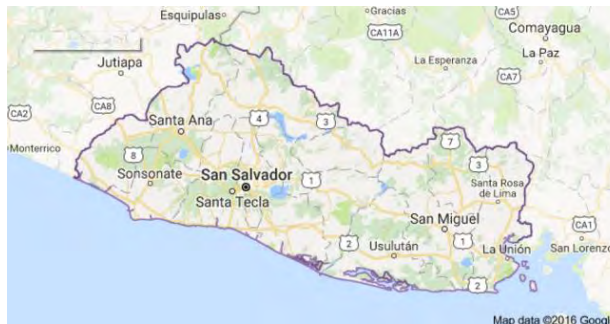
Mapa de El Salvador