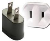
Tipo A: “Clavijas japonesas A”

Las clavijas a utilizar en Panamá son del tipo A / B: