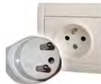
Tipo E: Válido para clavijas C. Tipo F necesita un agujero de alfiler