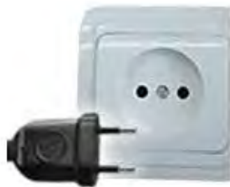
Tipo C: Válido para clavijas E y F

México tiene un voltaje inferior de 127 V, por lo que se recomienda utilizar un regulador de corriente para que no se estropeen los aparatos eléctricos.