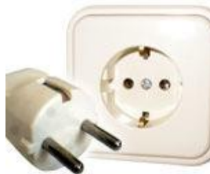
Tipo F: Válido para clavijas C