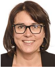
Sra. Diana Riba I Giner

España Ciudadanos – Partido de la Ciudadanía