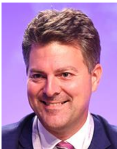
Sr. Andreas Schwab

Portugal, Partido Social Democrata (Portugal)