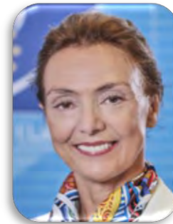
Sra. Marija Pejčinović Burič

Secretaria General del Consejo de Europa