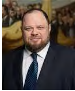
Sr. Ruslan Stefanchuk