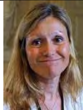
Sra. Yael Braun-Pivet

Presidenta de la Asamblea Nacional de Francia