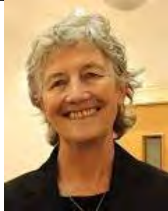
Sra. Catherine Connolly

Vicepresidenta de la Cámara de Representantes de Irlanda