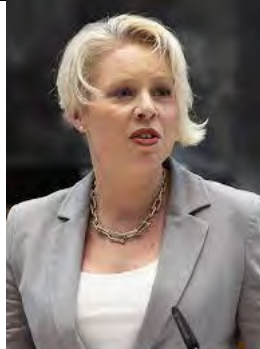
Sra. Urška Klakočar Zupančič

Presidenta de la Asamblea Nacional de Eslovenia