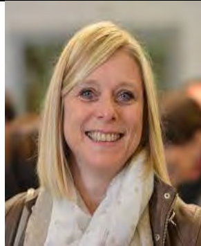
Sra. Eliane Tillieux

Presidenta de la Cámara de Representantes de Bélgica