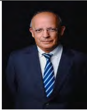
Sr. Augusto Ernesto Santos Silva

Presidente de la Asamblea de la República de Portugal