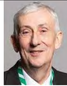
Sir Lindsay Hoyle

Presidente de la Cámara de los Comunes del Reino Unido