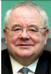
Sr. Sean Ó Fearghail

Presidente de la Cámara de Representantes de Irlanda