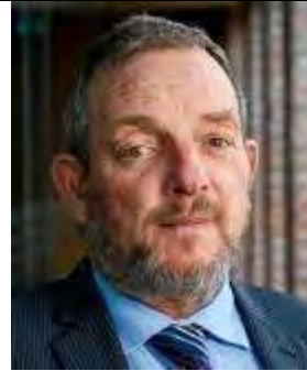
Sr. Jerry Buttimer