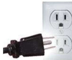
Tipo B: A veces válido para clavijas A