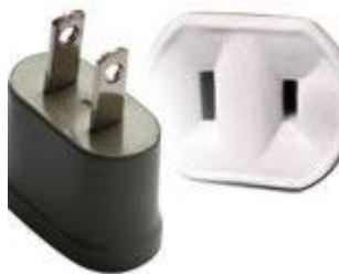
Tipo A: Clavijas japoneses A