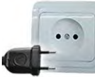
Tipo C: Válido para clavijas E y F