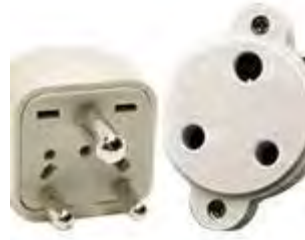
Tipo D: Válido para clavijas M