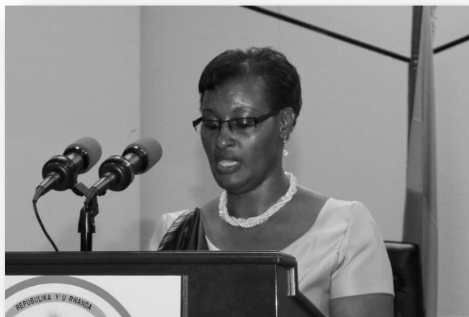
Donatille Mukabalisa Presidenta de la Cámara de Diputados de Ruanda

Este pasado fin de semana, en el marco del Día Internacional de la Mujer, fueron reconocidos los logros de Ruanda en la representación de las mujeres en la vida pública por todo el mundo.