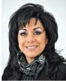
Sen. Lucero Saldaña Pérez